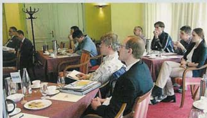
▲ Tijdens een seminar worden de mogelijkheden van de software uitgebreid belicht.

De komende maanden zijn er weer vele beurzen en evenementen om u te oriënteren op de voordelen van de Autodesk software en applicaties in uw bedrijfsproces. Er worden ook regelmatig testdrives of hands-on workshops georganiseerd. Hier kunt u onder begeleiding van een ervaren trainer zelf achter de computer plaatsnemen om aan de hand van een aantal voorbeelden zelf met de software te werken. Een volledig overzicht van de evenementen vindt u op pagina 18. Een actueel overzicht met extra informatie vindt u op www.manandmachine.be . Klik op seminarkalender op de homepage.